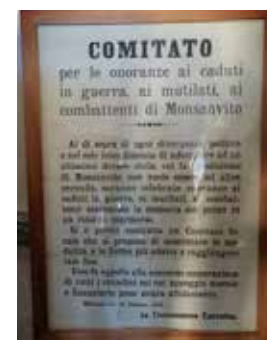
manifesto originale dell'epoca presente in sezione