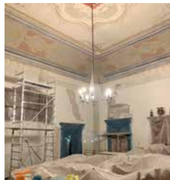
Lavori al palazzo comunale per la sistemazione di uffici e sala consiliare