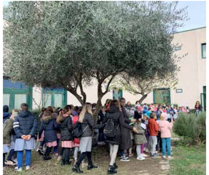
Festa dell'albero, 21 novembre