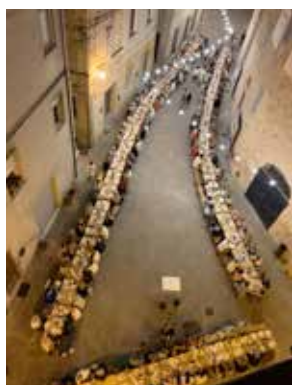
Cena del Castello, 10 agosto

Popolazione residente al 25/11/2019 n. 6.789 Di cui n. 3.331 Maschi e n. 3458 Femmine