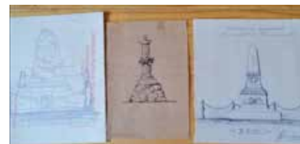
schizzi originali presenti in sezione