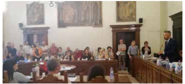
Primo consiglio comunale