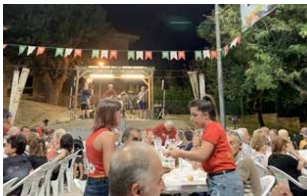
Cena frazione Santa Lucia, 26 luglio