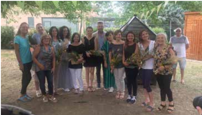
Festa di fine anno dell'asilo nido "Arcobaleno"