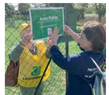
Iniziativa "Puliamo il mondo", 20 settembre