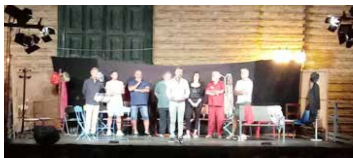
Serata inaugurale di "Teatro in piazza", con i presidenti delle associazioni