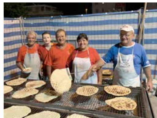
Festa della crescia alla frazione Le Cozze, tradizione settembrina