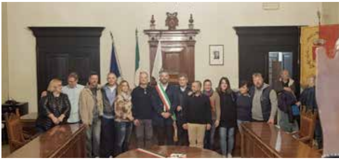
L'elezione del Sindaco, 27 maggio