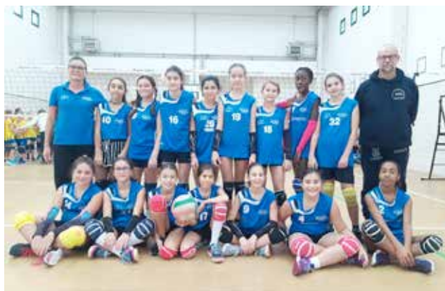
(under 13 pricess cup asd volley due)

motricità e le mette in condizione di apprendere i fondamentali, e il consolidarsi dei rapporti con l'UPR di Montemarignano, un legame stretto che mette in rete la passione dei dirigenti, le professionalità degli allenatori e l'impegno delle giocatrici. Da quest'ultima arriva un altro segnale confortante, perché oltre alla presenza negli allenamenti le ragazze dimostrano di star facendo gruppo, di coniugare le proprie individualità con le esigenze del gioco di squadra, atteggiamento questo che favorisce la crescita sia sportiva che caratteriale. I dirigenti della Volley Due, consapevoli del ruolo dello sport, chiedono su queste linee l'appoggio dei genitori, delle amministrazioni locali e delle realtà produttive del territorio, e approfittano di questo spazio per porgere a tutti sentiti auguri per le prossime festività natalizie.